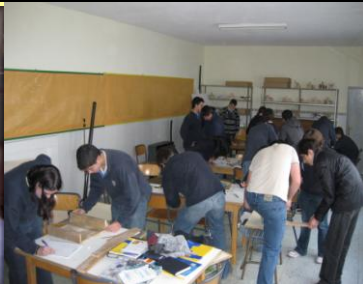
Taller de Tecnología