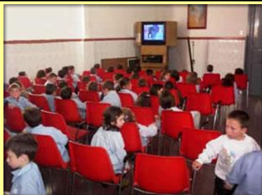
Salón de Actos