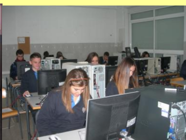
Aula de Informática